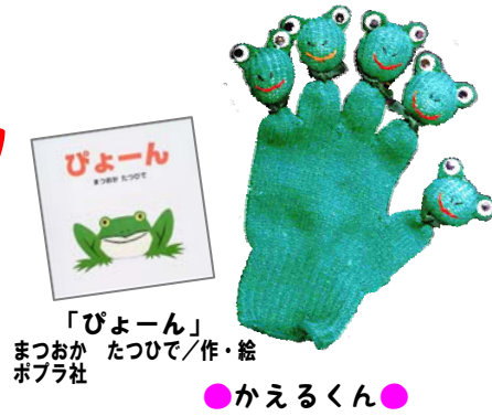
「びよーん」 まつおか たつひで/作・絵 ポプラ社

パペット人形とは、手指で操る人形のことをいいます。 南アルプス市立図書館のパペット人形は、子どもに人気の動物や 絵本の主人公などを中心に、手袋や布切れなどを利用して、図書館 ボランティアのみなさんが制作しています。 1家族に2組まで貸し出しもしています。 パペット人形の楽しみ方は自由です。色々な方法で本の世界を広げてみては、いかがでしょうか?