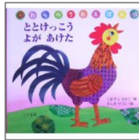
「ととけっこうよがあげた」 こばやし えみこ/案 ましま せつこ/絵 こぐま社