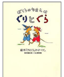
「ぼくらのなまえはぐりとぐら」 絵本「ぐりとぐら」のすべて。 福音館書店母の友編集部/編 福音館書店