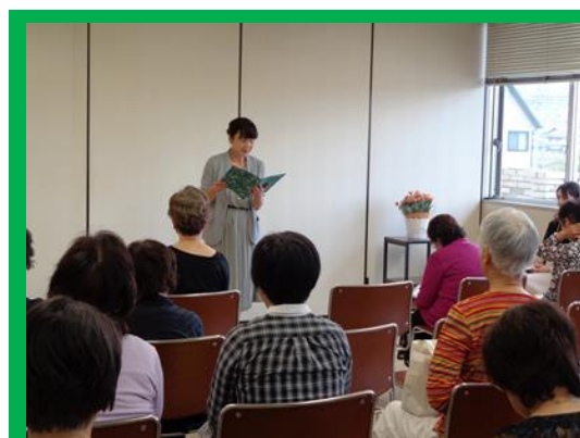
【5月11日「ふれあい処」の様子】