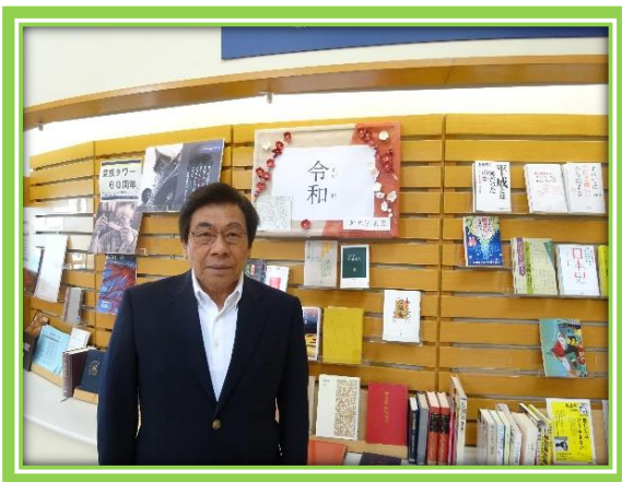
【図書館エントランスにて】

この情景は、かつての山梨県立図書館4階の郷土資料室から見た西方の檜形山、さらに南アルプスの峰々の夕景を謳っています。辻邦生は、フランス文学の系統をひく作風で知られる作家です。そんな洒落た作風を持つ辻邦生が描いたこの『銀杏散りやまず』は、亡き父への追慕の中で、甲斐国の国府村(笛吹市春日居町)に端を発する辻家の先祖を辿った物語です。その執筆作業の中で、山梨県立図書館が所蔵する「辻家文書」という古資料に巡り会う偶然をドキュメンタリータッチを織り込んで描いています。