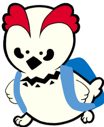
南アルプス市立図書館マスコットキャラクター ライライ