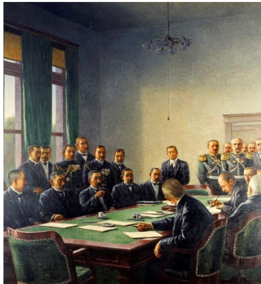
正直もかかわった、講和条約調印の光景を描いた絵画「ポーツマス講和談判」の複製（白滝幾之助／画）【聖徳記念絵画館蔵】