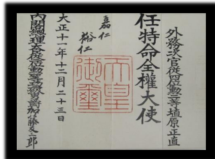
米国特命全権大使任命状【早稲田大学図書館蔵】