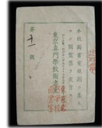
東京専門学校（現早稲田大学）図書室の「図書閲覧票」表裏【個人蔵】