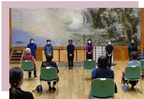
朗読会やすらぎ亭の様子 令和 2 年 12 月 5 日開催