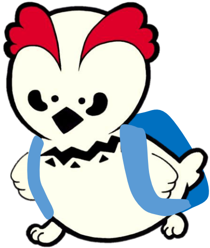
南アルプス市立図書館マスコットキャラクター