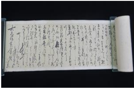
元恭が大久保黄齋に宛てた書状 【個人所蔵】