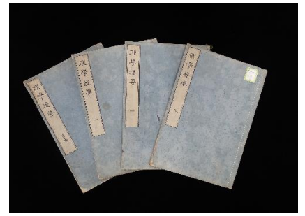
『理學提要』 医学の基礎は物理学・化学にあると訳述した 【山梨県立博物館所蔵】