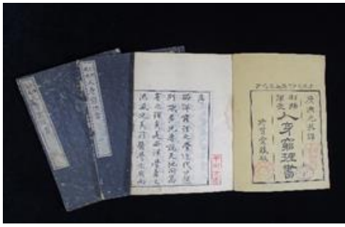
『利撰蘭度人身窮理書』 元恭が訳述した日本最初といわれる生理学書 【山梨県立博物館所蔵】