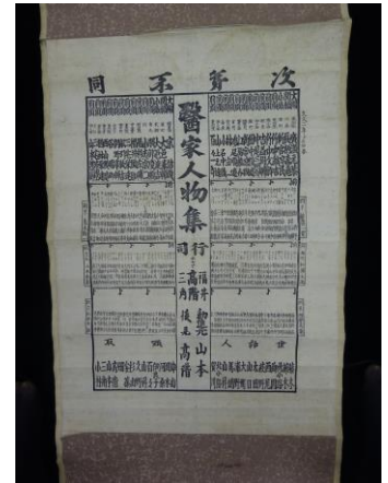
「医家番付の掛軸」 相撲番付のように大関から並び 東の大関に元恭の名がある 【個人所蔵】