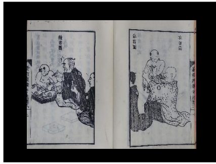
『新訂牛痘奇法』 牛痘の取苗・伝苗・種苗の絵図がある