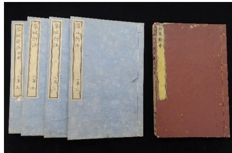
『築城新法』『刀圭餘事』 元恭は医学書のほかに兵学書等も刊行した 【順天堂大学医学部医史学研究室所蔵】