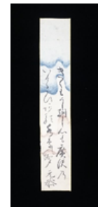
元恭が詠んだ和歌 【山梨県立博物館所蔵】