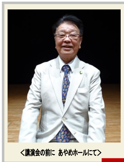
<講演会の前に あやめホールにて>

「読書」はどこでもできます。どんな古い本でも図書館で読めます。素晴らしい読書体験をぜひ、あなたも。