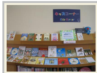
<寄贈いただいた本>

中央図書館の「おはなしのへや」と「キッズコーナー」に展示してありますので、ぜひご覧いただき、本選びの参考にしてください。