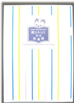
ライライのクリアファイル

南アルプス市立図書館ホームページ ( https://m-alps-lib.e-tosho.jp/ ) でご覧いただけます。