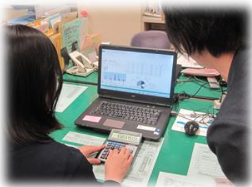
＜アンケートの集計作業のようす＞