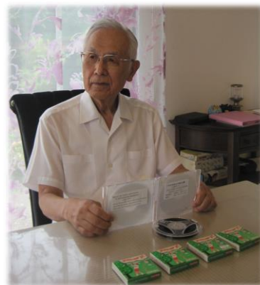
(4本の8ミリフィルムを前にして)